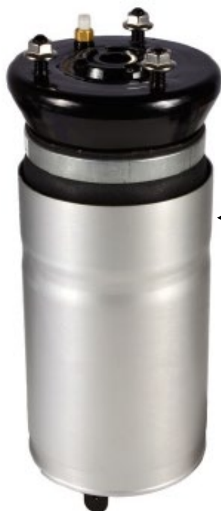
5. 1x Modul perna de aer